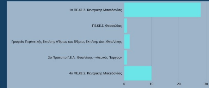
Γράφημα 2: Αριθμός σχολικών τάξεων που συμμετείχαν στο πρόγραμμα