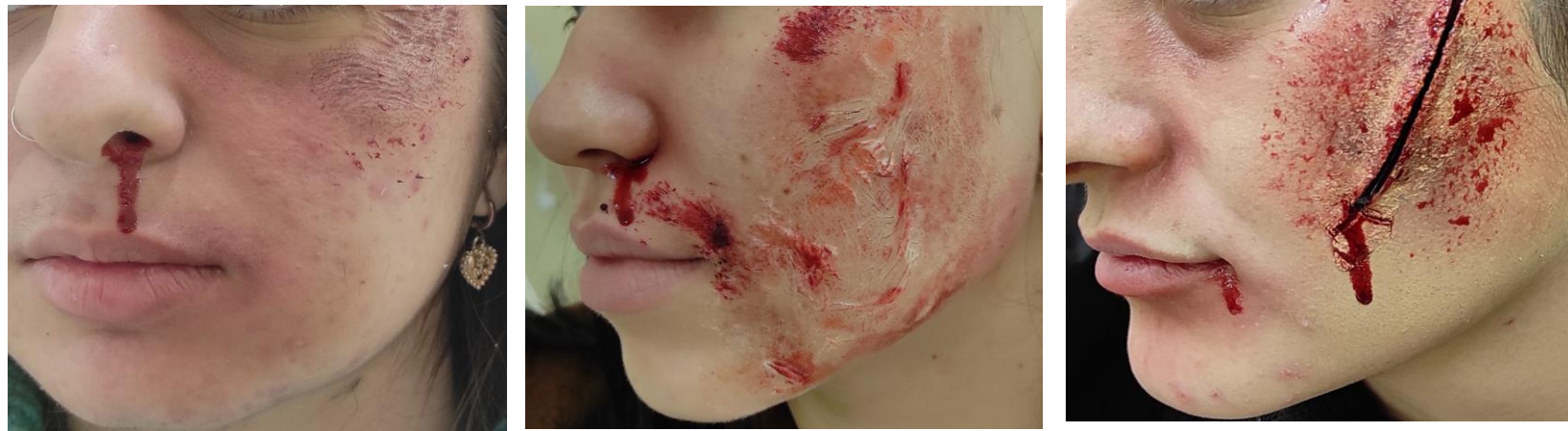
Εικ.2 Μακιγιάζ προσώπων κακοποιημένων γυναικών στο σχολικό εργαστήριο